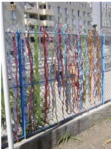
Maternelle M. Renaud, Montpellier