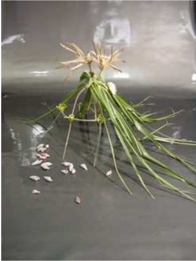
Ecole élémentaire, Vendargues Artiste intervenante: Christine Boileau