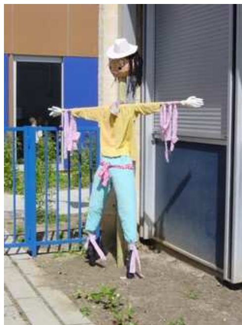
Maternelle M. Renaud, Montpellier