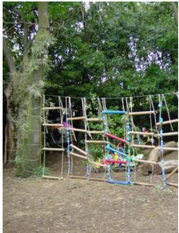
Tubes de carton bruts ou peints et bouchons.

Ecole élémentaire, Murviel les Montpellier