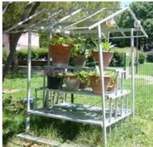
Cabane-étagère en métal, récupération.