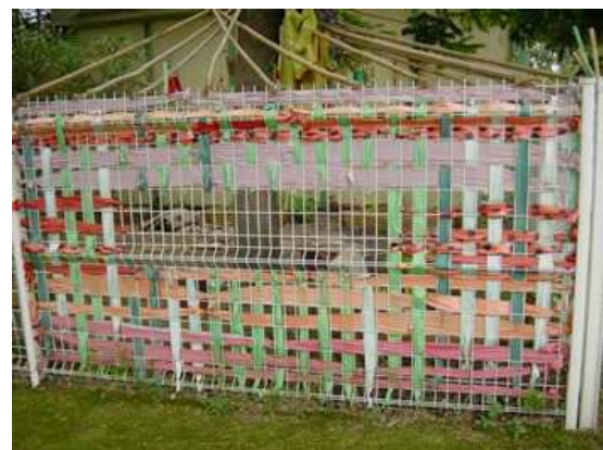
Maternelle M. Brès, Montpellier

Tissage vertical ou croisé de bandes de tissus colorés.