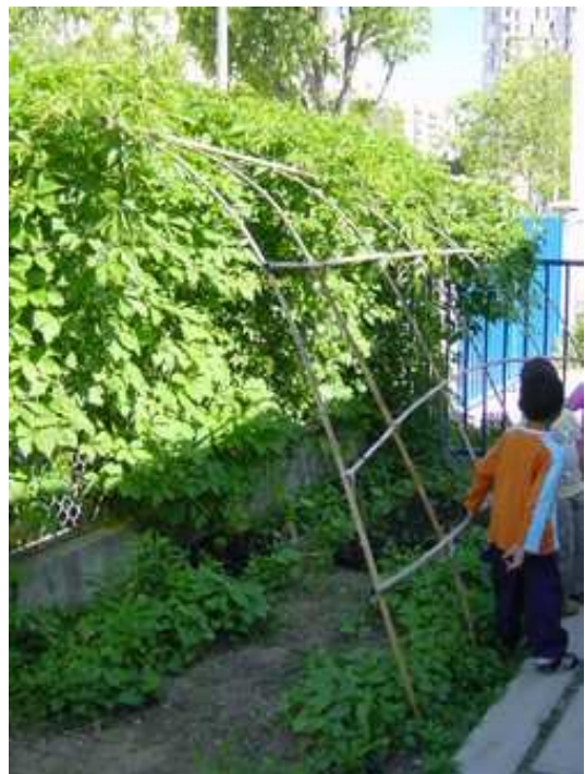
Cabane-tunnel en bambou, appuyée contre la clôture.