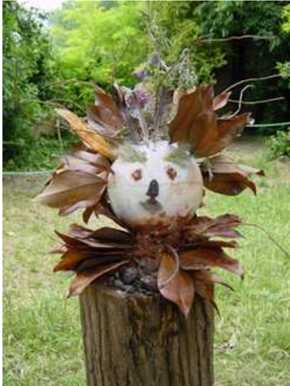
Epouvantail végétal: éléments naturels piquants fixés sur une grosse boule de polystyrène posée sur un tronc d'arbre coupé..