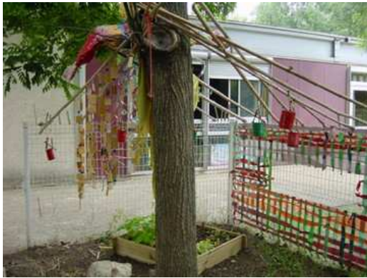
Maternelle M. Brès, Montpellier

Un arbre existant habillé de mobiles et de lampions marque l'emplacement du « coin à histoires » du jardin.