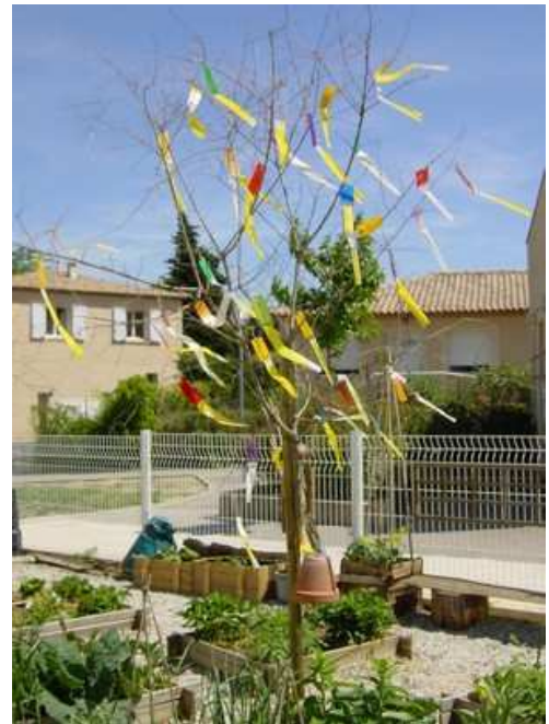
Maternelle Murviel les Montpellier

Un arbre existant habillé de mobiles et de lampions marque l'emplacement du « coin à histoires » du jardin.