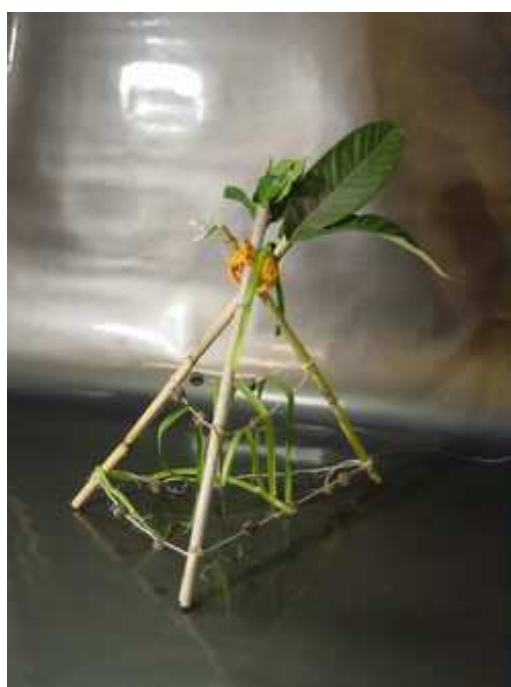
Ecole élémentaire, Cournonsec