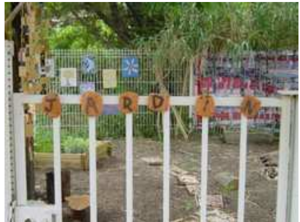
Maternelle M. Brès, Montpellier

Collage de briques roulées trouvées sur la plage décorées avec des graines pour écrire le mot « jardin ».