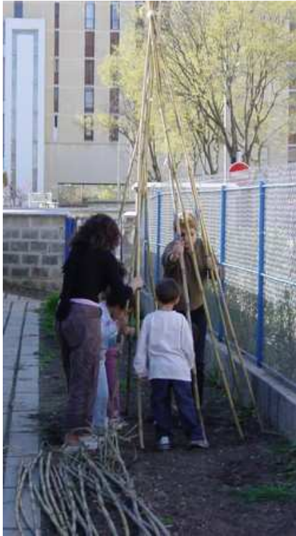
Cabane-tipi en bambou. Des plantes grimpantes viendront l'habiller.