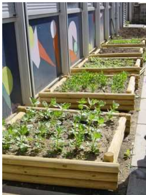
Jardin potager en carrés, le long des classes.