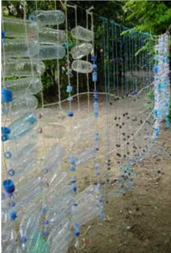
Bouteilles en plastique, bouchons et boules de cyprès fixés sur un réseau de ficelles tendues entre deux arbres.

Ecole élémentaire, Murviel les Montpellier