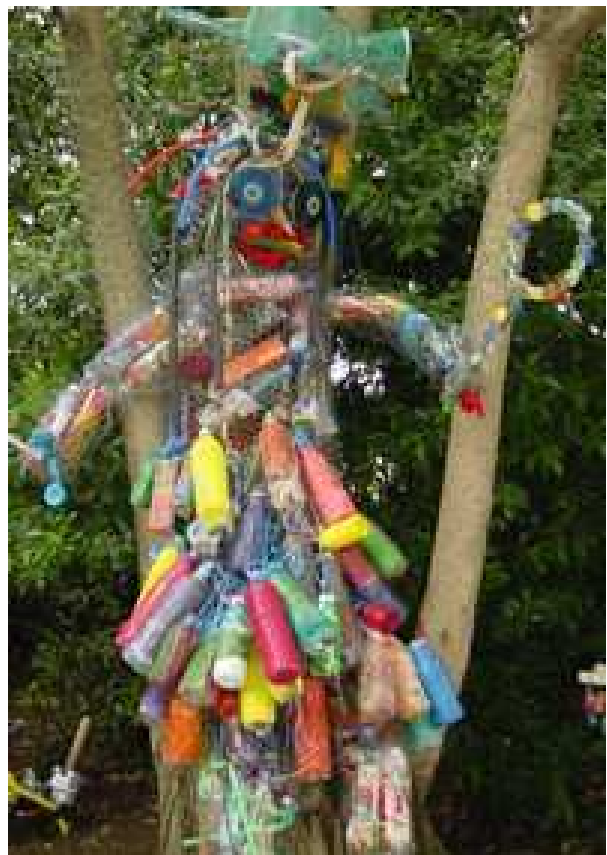
Réemploi de déchets: bouteilles en plastique colorées, bouchons, cerceaux, jouets... sur une armature en grillage alvéolé.